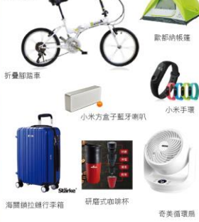
圖片顯示內容僅供參考以實體為主，主辦單位有權調整獎品內容及數量